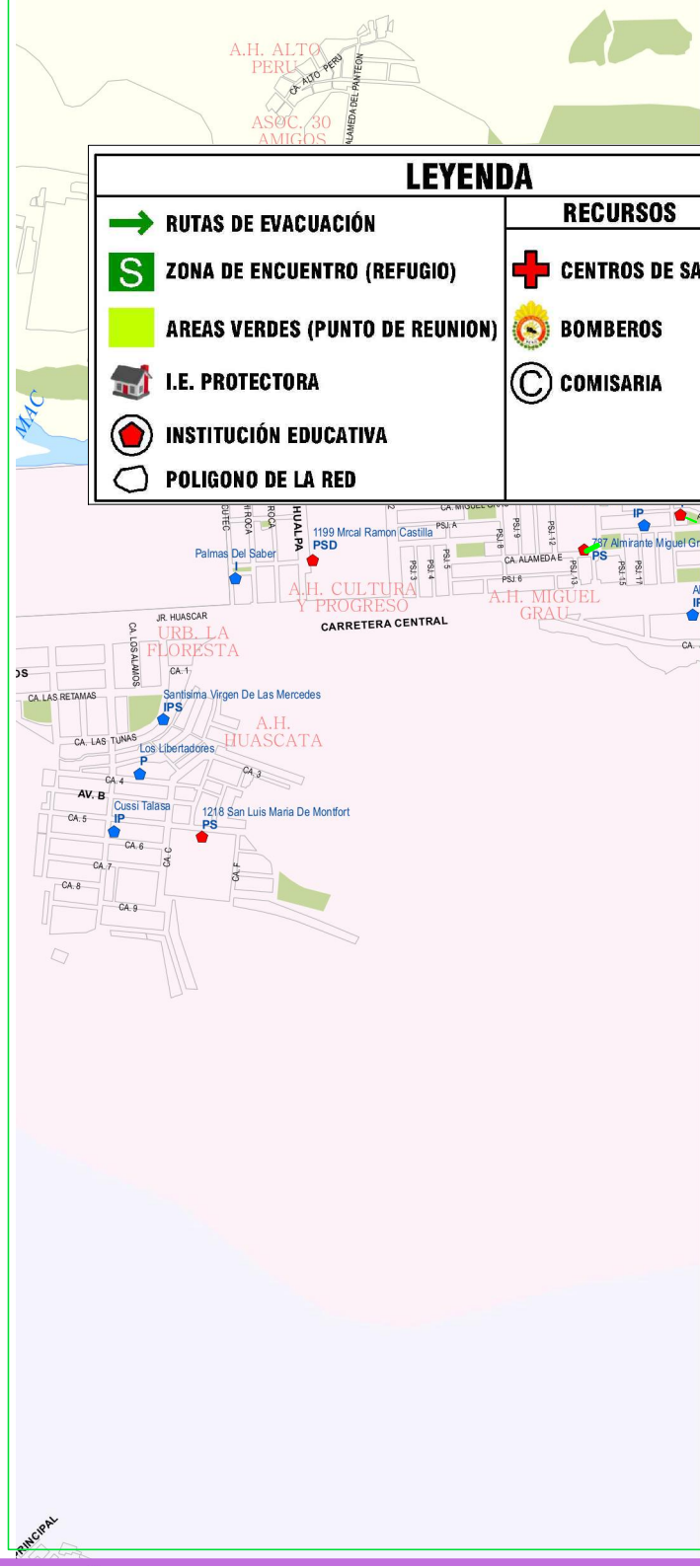
MAPA DE UBICACIÓN, ZONAS DE REFUGIO Y RUTAS DE EVACUACIÓN EN CASO DE SISMO UGEL 06 - RED 18